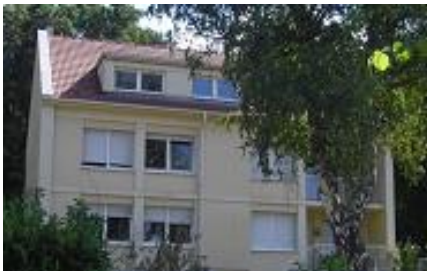
Les préadolescents de Forbach ont emménagé au cours de l'été dans cette nouvelle maison rue d'Alger

Les groupes des Zouzous et des Lucioles, à la Pouponnière, ont bénéficié d'une rénovation et d'une correction acoustique de leur salle de vie.