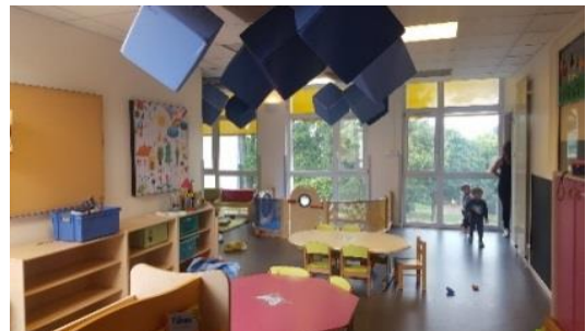
Exemple de travaux d'embellissement : une chambre du Jardin d'Enfants

Les groupes des Zouzous et des Lucioles, à la Pouponnière, ont bénéficié d'une rénovation et d'une correction acoustique de leur salle de vie.